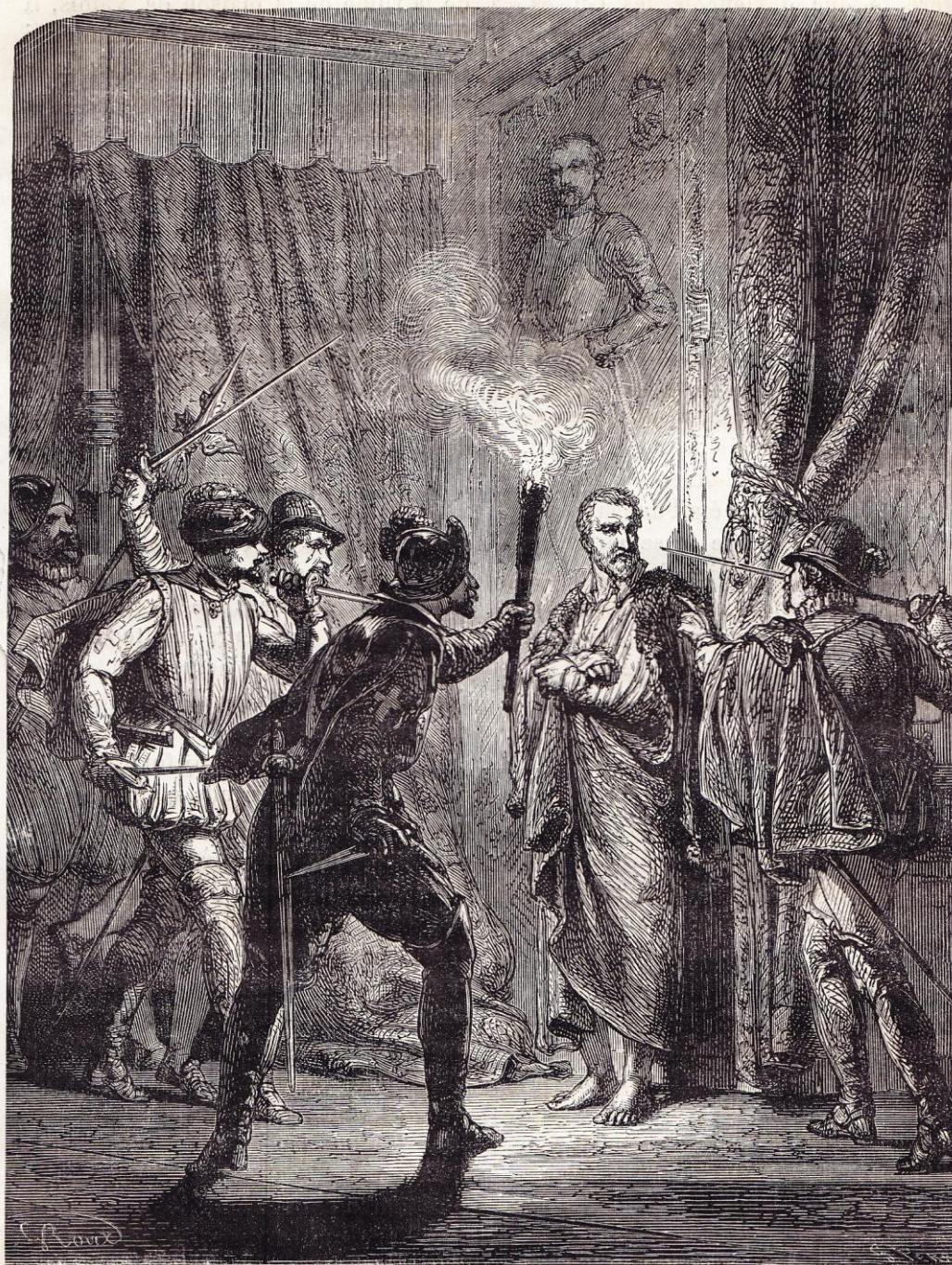
LA SAINT-BARTHÉLEMY. — Assassinat de l'amiral Coligny.

Charles IX qui la reçut fort mal et lui dit brutalement qu'il n'avait pas de plus grands ennemis qu'elle et son frère le duc d'Anjou. Le moment était venu d'agir et il était d'autant plus propice que le duc d'Anjou, son jeune